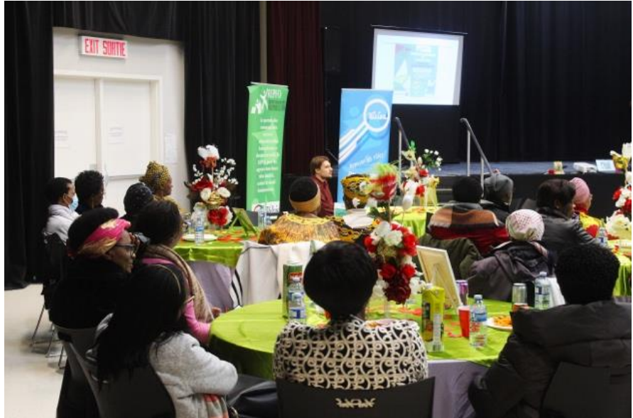
Café rencontre CREPAN

Le Centre de ressources pour les parents noirs ( CREPAN ), dans le cadre du volet autonomisation économique du Plan d'action pour les jeunes noirs (PAJN) de l'Ontario, soutient les jeunes et les familles noirs dans leur réussite sur le plan social et économique. Ce programme est rendu possible grâce au financement du ministère des Affaires civiques et du Multiculturalisme .